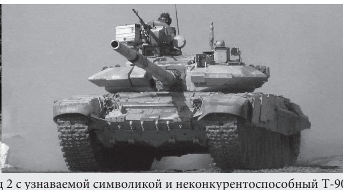
Современный немецкий танк Леопард 2 с узнаваемой символикой и неконкурентоспособный Т-90

Но немецкие танки мы на параде Победы над фашистской Германией еще несколько лет не увидим. Народ не настолько деградировал. И все-таки 9 мая мы увидели НАТОвскую технику на Красной площади.