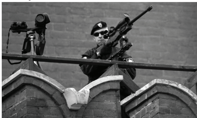
Снайпер ФСО с английской винтовкой на стенах кремля

У всех на слуху закупка нескольких вертолетоносцев Мистраль французского производства. Кто-то, возможно, слышал о закупках снайперских винтовок для различных спецподразделений.