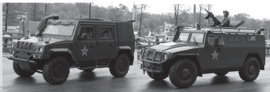
Итальянский броневик IVECO M65, броневик «Рысь» и броневедомобиль «Тигр» производства Арзамасского автозавода

нитый «Тигр» собирался на Арзамасском заводе, находящемся под влиянием небезызвестного О. Дерипаска. Олигарх уже выказывал свои намерения о распространении интересов на сферу белорусского автомобилестроения, но ощутимой поддержки со стороны руководства этой страны не нашел.